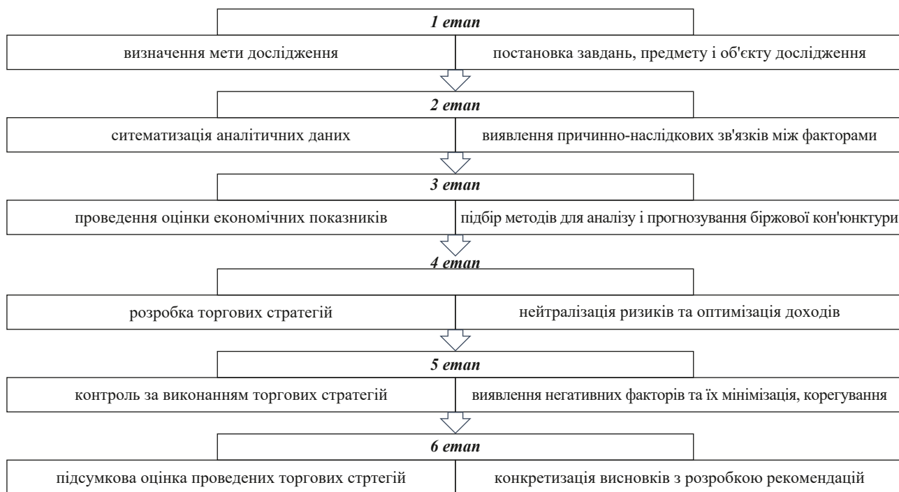
Рис. 2. Основні етапи економічного аналізу на організованих товарних ринках