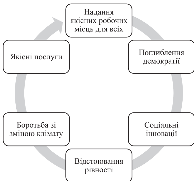
Рис. 1. Переваги соціальної економіки