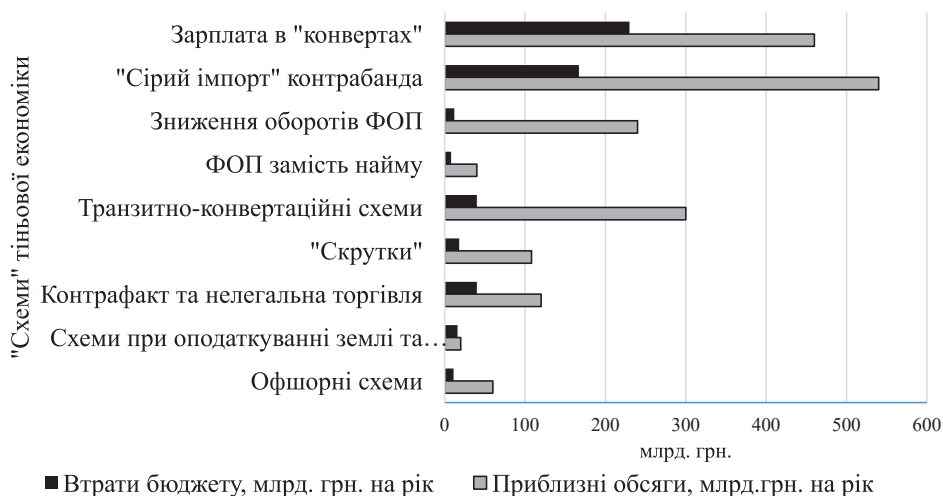
Рис. 2. Приблизні обсяги тіньової економіки та втрати бюджету від кожної тіньової схеми [6]