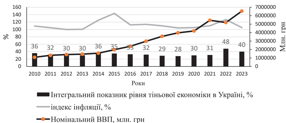
Рис. 1. Динаміка інтегрального показника рівня тіньової економіки, ВВП та індексу інфляції України з 2010–2023 рр.

Аналіз тіньової економічної діяльності дає підстави стверджувати, що неформальна і прихована економіка не тільки має негативні наслідки, але і служить своєрідним амортизатором при вирішенні соціально-економічних проблем: формує шар підприємців, впливає на накопичення вільних грошових коштів, створює умови для самозайнятості та додаткової зайнятості. Також слід зазначити, що тіньова економіка є частиною суспільного виробництва, виробляючи певну частину ВВП і саме в ній створюється дохід для широкого прошарку населення, яке створює додаткову частку споживчого попиту. Таким чином, тіньову економіку можна розглядати як об'єктивно обумовлений