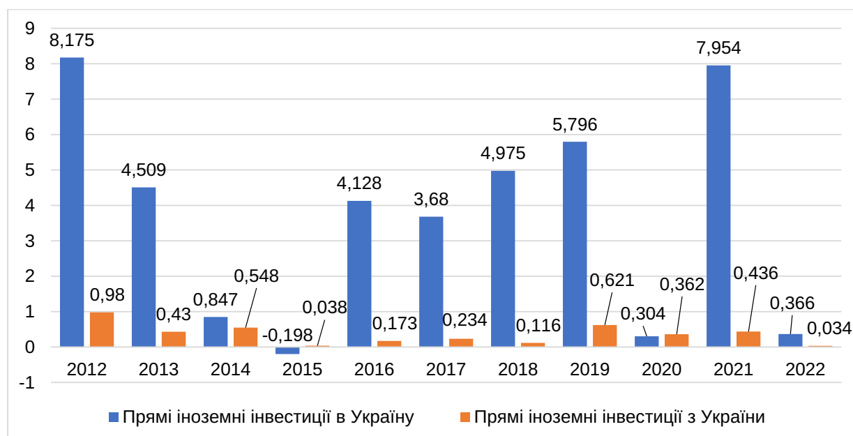
Рис. 1. Динаміка ПІІ в економіку України протягом 2012–2022 рр., млрд дол. США [4; 5]

Ці країни є традиційними лідерами за обсягом інвестицій в Україну протягом багатьох років, але в зв'язку із повномасштабним вторгненням росії на територію України до даного списку можна віднести і США.