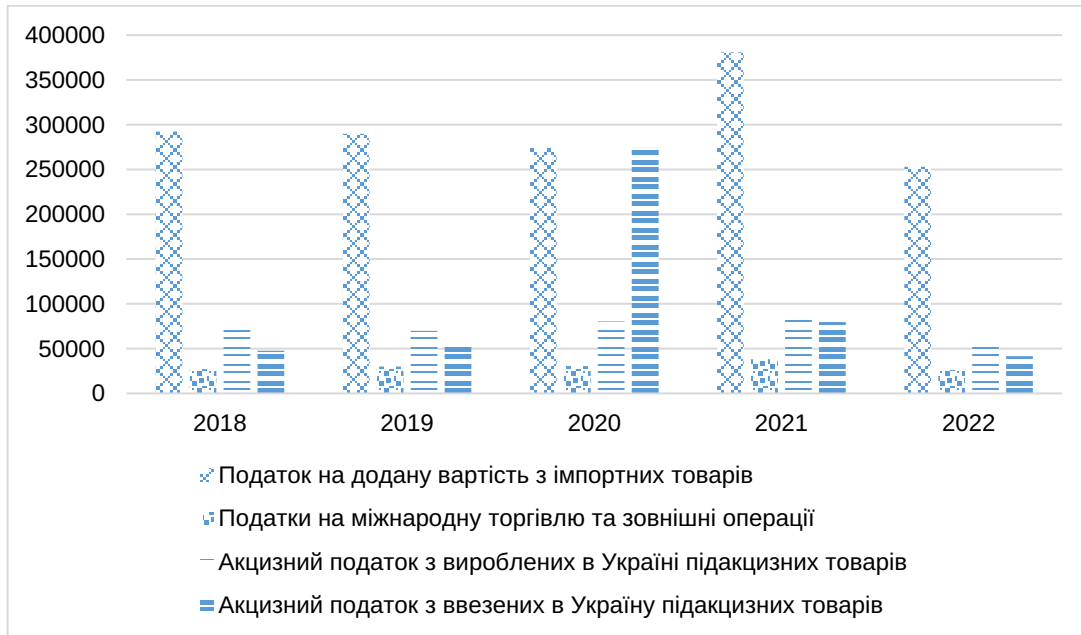
Рис. 2. Доходи державного бюджету України за статтями доходів в 2018–2022 рр. (млн. грн.)

1) призупинення виробництва паливно-мастільних матеріалів в Україні;