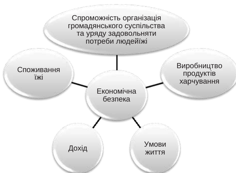
Рис. 1. Складові економічної безпеки згідно із підходом Міжнародного комітету Червоного Хреста