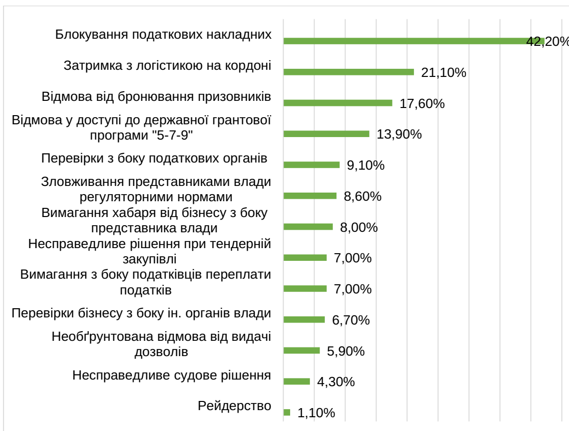
Рис. 2. Проблеми взаємодії бізнесу з органами влади (січень 2023 р.)

Загалом, серед опитаних підприємців станом на грудень 2022 року, 58% були незадоволені станом справ у їхньому бізнесі; задоволено лише близько 24% респондентів. 42% підприємців вважали несприятливою загальну економічну обстановку в Україні, а 29% називали її катастрофічною. Прогнози на найближче майбутнє теж не були оптимістичними: 38% опитаних вважали, що ситуація в наступні півроку погіршуватиметься, і лише 33% вірили у позитивні зміни. Зате майже 76% суб'єктів підприємницької діяльності мали намір розширювати бізнес протягом 2023 року: