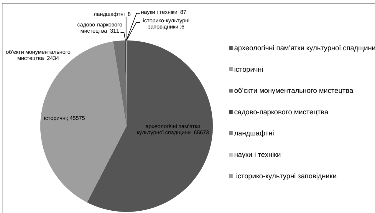
Рис. 1. Пам'ятки культурної спадщини станом на 01.01.2021 року

Україну за 2021 рік відвідали 4 271 991 іноземних туристів. Це на 26,3% більше, ніж у 2020 році. Найбільша кількість туристів прибула з Молдови (1, 054 мільйона); Росія (519 тисяч); Польща (311 тисяч); Білорусь (273 тисяч); Румунія (264 тисячі); Туреччина (247 тисяч); Угорщина (227 тисяч); Німеччина (154 тисячі); Ізраїль (133 тисячі); США (103 тисячі).