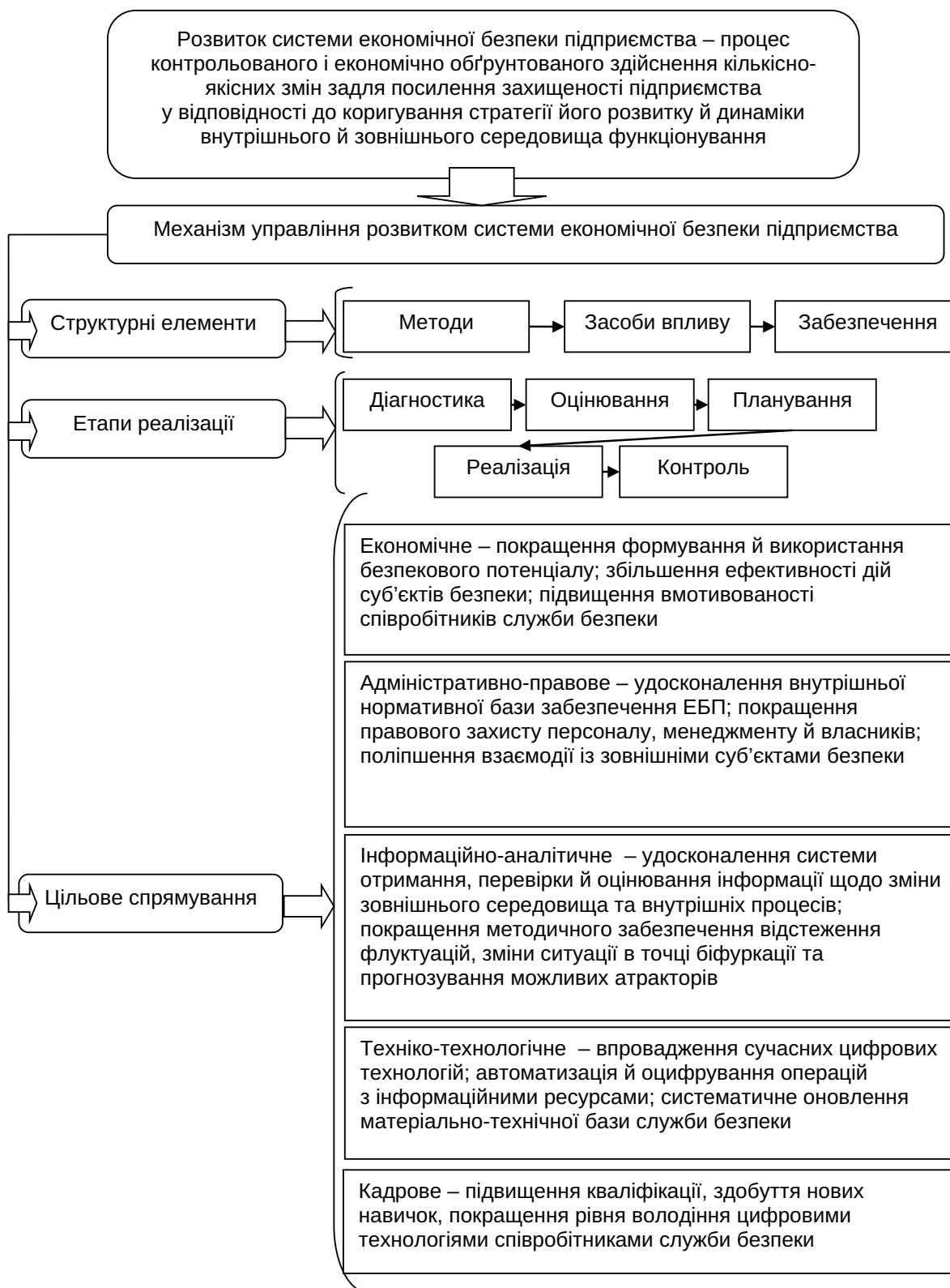
Рис. 2. Механізм управління розвитком системи економічної безпеки підприємства