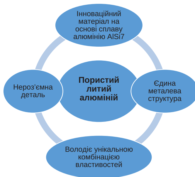
Рис. 1. Інноваційна технологія АТ «ЕЛМІЗ»

В основі функціонування даного підприємства лежить бізнес-модель складена за методикою «Canvas», яка складається з 9 структурних блоків (табл. 3). Інноваційні бізнес-моделі – це інтегруюча