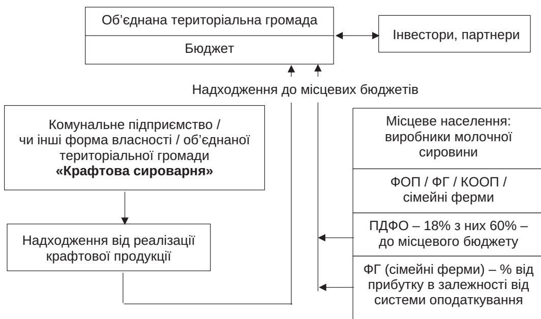
Рис. 2. Фінансові надходження до бюджету громади від розвитку аграрного підприємництва

Звертаючи увагу на канали фінансових надходжень до бюджету громади від розвитку аграрного підприємництва, слід також наголосити на тому, що громада отримує найбільше надходжень якраз від підтримки розвитку малого та індивідуального підприємництва [9]. Тобто, коли виробники сільськогосподарської сировини зареєстровані як фізичні особи-підприємці. У такому випадку громада отримує 60% від 18% податку на доходи фізичних осіб до власного бюджету і є зацікавленою у максимальній кількості таких підприємців. При створенні комунального підприємства громада отримує весь прибуток від діяльності такого підприємства, а також власну промоцію