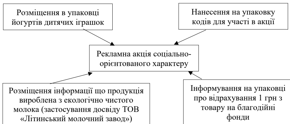
Рис. 2. Складові соціально-орієнтованих рекламних акцій молокопереробних підприємств

Сучасні тенденції світового ринку безлактозної молочної продукції показують збільшення обсягів заготівлі козиного молока у цілях виробництва дитячого харчування, лікувального харчування та