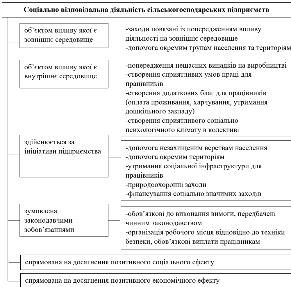
Рис. 2. Класифікація соціально відповідальної діяльності сільськогосподарських підприємств за ознакою цільової спрямованості

Перелік показників для оцінки рівня соціально відповідальної діяльності сільськогосподарських підприємств першочергово залежить від їхнього статусу. Передусім доцільно застосовувати економічні параметри соціальної результативності