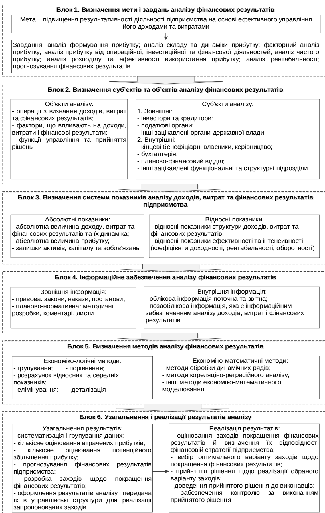
Рис. 1. Організаційно-інформаційна модель аналізу фінансових результатів