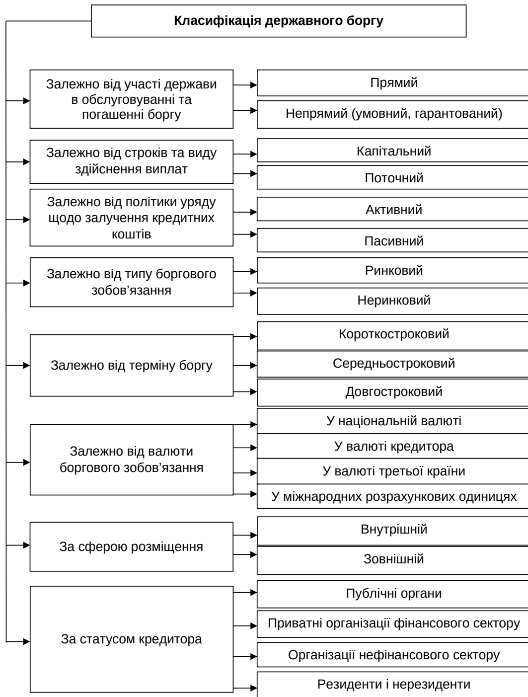
Рис. 2. Класифікація державного боргу