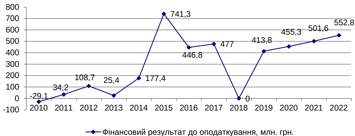
Рис. 2. Динаміка фактичної та прогнозної величини фінансового результату до оподаткування аграрних підприємств Сумської області [8]

В сільському господарстві, діяльність якого пов'язана з використанням землі як основного