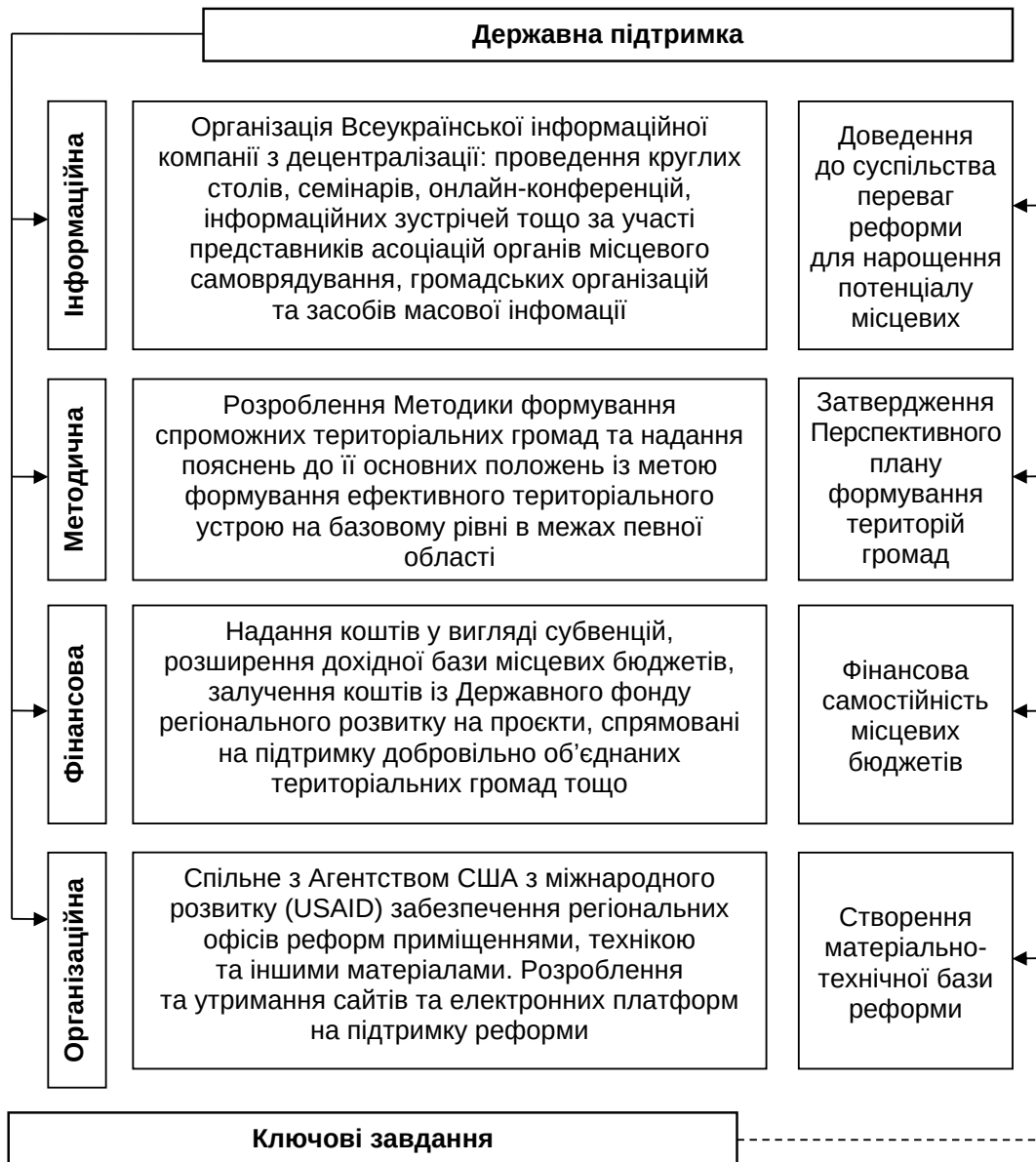
Рис. 1. Форми державної підтримки територіальних громад