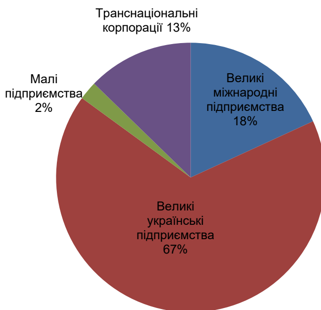
Рис. 1. Типи компаній Спільноти соціально відповідального бізнесу

Виклад основного матеріалу дослідження. Сьогодні у Спільноту соціально відповідального бізнесу, що заснована для популяризації та розвитку тематики соціальної відповідальності бізнесу в Україні агенцією економічного розвитку PPV Knowledge Networks, об'єднано 314 компаній різних галузей діяльності. На рис. 1 відображено типи компаній Спільноти соціально відповідального бізнесу.