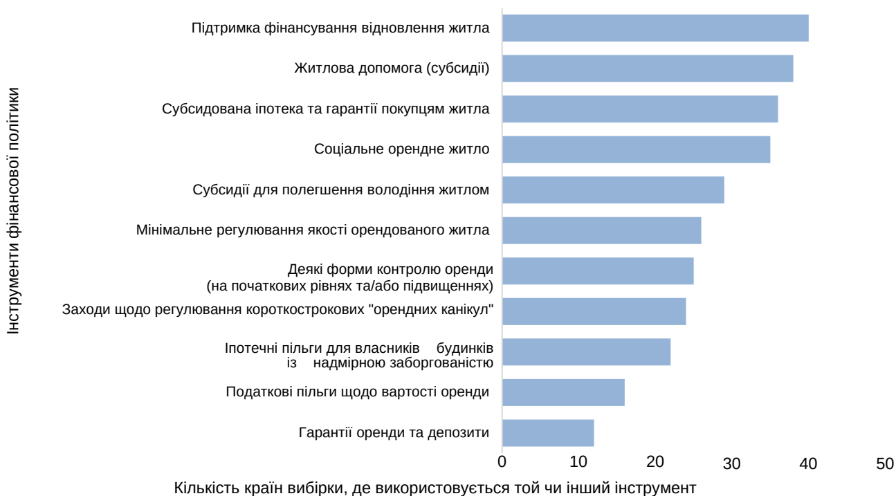
Рис. 3. Основні інструменти державної фінансової політики у сфері забезпечення соціального та доступного житла