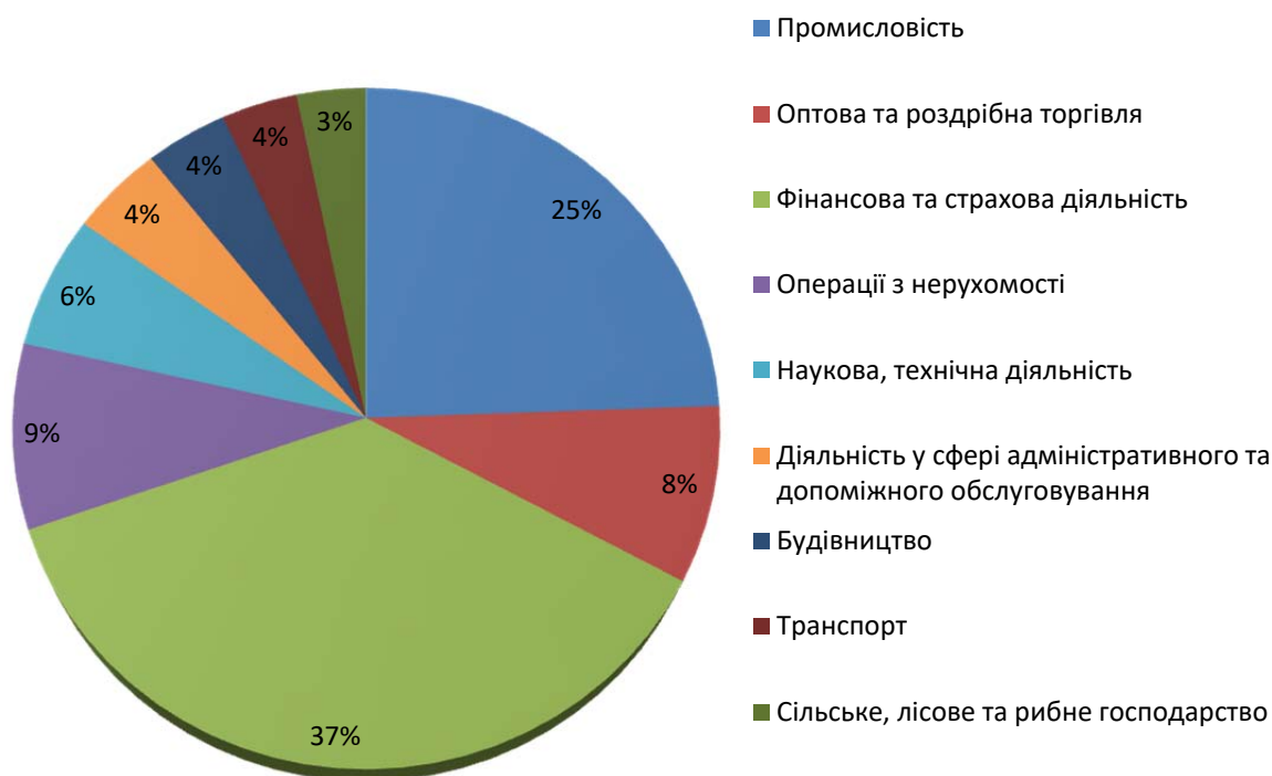
Рис. 3. Структура іноземних інвестицій за галузями в Україні за 2019 р. [4]