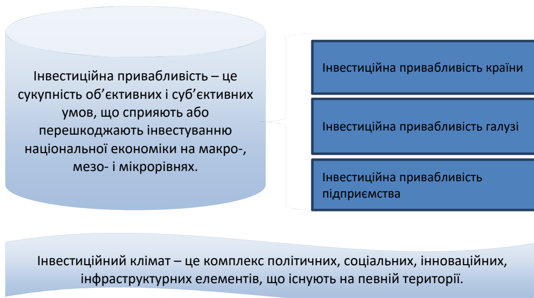
Рис. 1. Формування інвестиційної привабливості – рівні

До внутрішніх чинників слід віднести: фактори виробництва, маркетингову діяльність, наявність