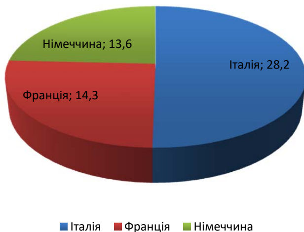
Рис. 4. Головні імпортери вина за 2019 р. [4]

а через 2–3 роки (в промислових масштабах – через 4 роки). Міністерство намагається створити оптимальні умови для виробництва, але власники виноградників витрачають кошти для того, щоб реалізувати продукцію, хоча скасовано ліцензію на право реалізації винопродукції із власних вино-матеріалів.