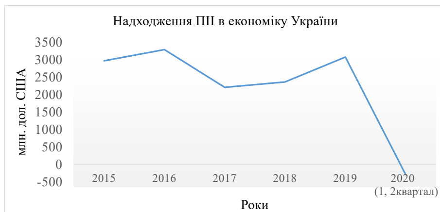
Рис. 1. Динаміка обсягів надходжень ПІІ в економіку України

До 10 найбільших країн-інвесторів, як і раніше, належать Кіпр, Велика Британія, Нідерланди і решта країн. Основні країни-інвестори наведені у таблиці 2.