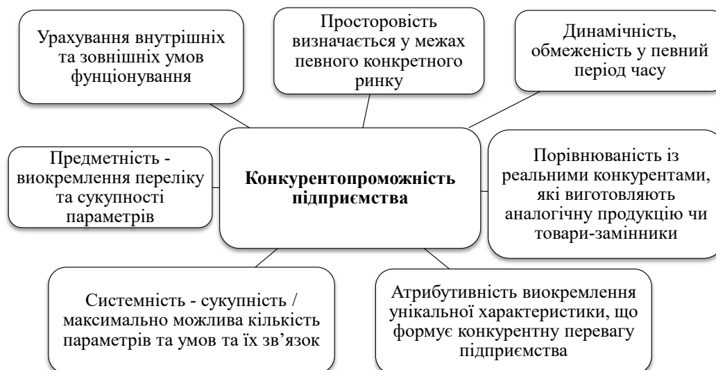
Рис. 1. Властивості конкурентоспроможності підприємства

Джерело: розроблено авторами на основі [6]