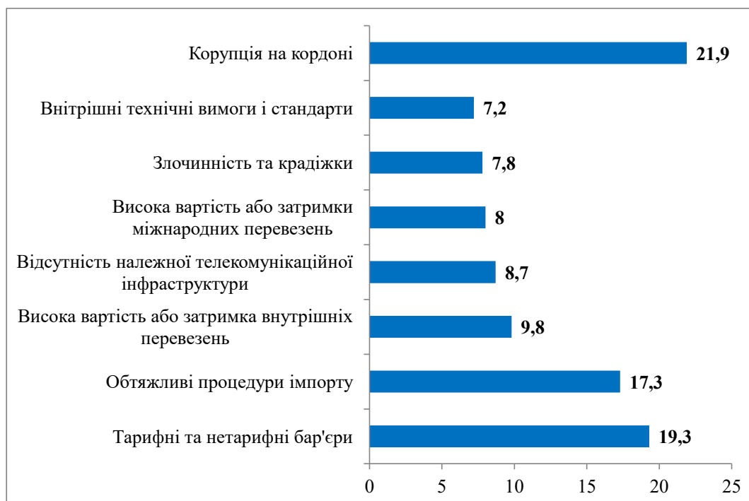
Рис. 1. Найбільш проблемні фактори, що впливають на здійснення імпорту в Україні, %

Доволі цікаве дослідження роботи вітчизняних митних органів проводять фахівці Інституту економічних досліджень та політичних консультацій, за результатами яких встановлено, що українські експортери оцінюють ефективність роботи митних органів в Україні у 2 рази вище, аніж імпортери. Щодо розміру підприємства, то великі суб'єкти господарювання найчастіше серед інших позитивно оцінюють ефективність функціонування митних