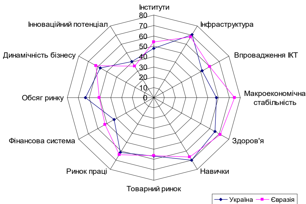
Рис. 1. Рейтинг України згідно з Індексом глобальної конкурентоспроможності у 2019 р.