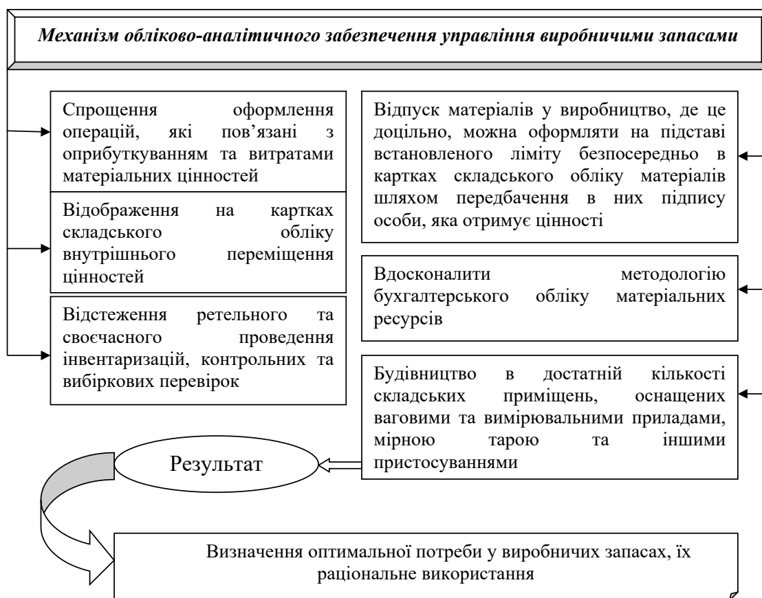
Рис. 1. Економічний механізм удосконалення обліково-аналітичного забезпечення управління виробничими запасами

Для того щоби звести до мінімуму кількість порушень та арифметичних помилок під час використання запасів, які підлягають обліковій реєстрації, бажано розробити детальні інструкції конкретним працівникам про чіткий порядок і терміни реєстрації облікових даних, а також використовувати систему заохочень чи покарань за виконання своїх безпосередньо прямих обов'язків. Чітке вжиття проведених контрольних заходів (інвентаризації, ревізії, звірки) знижує ризик неефективної системи збирання та реєстрації оперативної інформації.