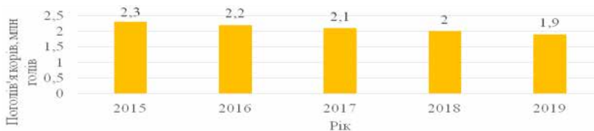
Рис. 1. Динаміка зміни кількості поголів'я корів за 2015–2019 рр.

Загалом тренд на функціональні продукти активно розвивається та перебуває тільки на початку шляху, проте багато компаній по всьому світі вже використовують рослинні рецептури у виробництві своєї продукції.