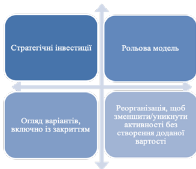
Рис. 3. Стратегічне позиціонування державних підприємств як суспільно-значущих

і ресурси. Слід зазначити, що державні підприємства на відміну від приватних мають інші цілі, завдання та соціальні наслідки. Ці підприємства спрямовують свою діяльність на сприяння соціальним результатам, розвиток інфраструктури та створення стабільності в кризові часи всередині та між ланцюгами постачань. Державні підприємства не повинні оцінюватись лише на підставі фінансових результатів (прибутку та збитку), а в ширшому сенсі, тому що вони сприяють створенню благ суспільного значення рис. 3.