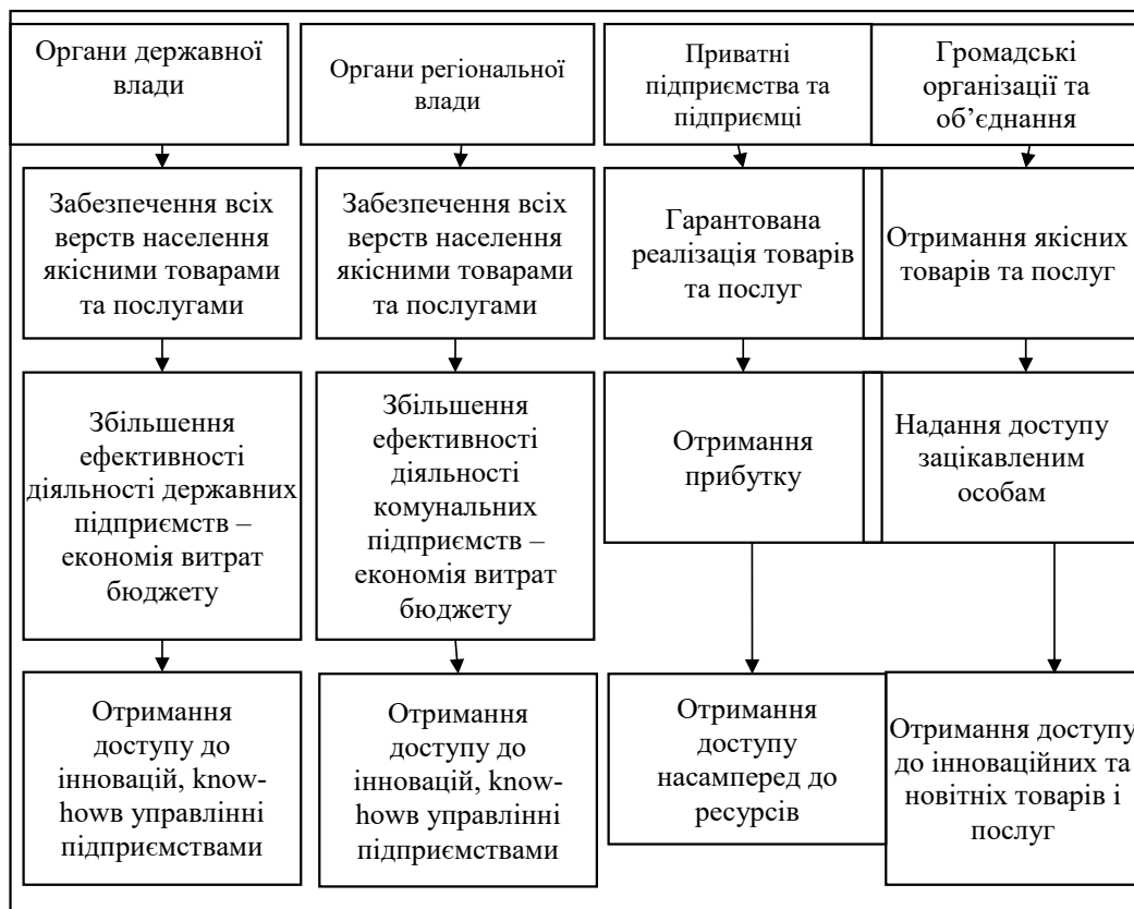
Рис. 2. Інтереси можливих учасників державно-приватного партнерства

З аналізу визначення терміну «державна регуляторна політика» витікає що це політика, яка містить певну сукупність інструментів, методів та важелів непрямого впливу для досягнення поставлених цілей переважно щодо стабілізації та врівноваження соціально-економічного розвитку та інших цілей економічного розвитку. Комплекс заходів та методів містить певні інструменти законодавчого, комплекс методів непрямого впливу і навіть створення державних підприємств для вирішення певних проблем. Останні існують там, де не можливо з деяких причин існування приватних. Державні підприємства – це ефективні інструменти позиціонування для деяких країн в світовій економіці, в якій набуває вирішального значення конкуренція за фінансування, талант