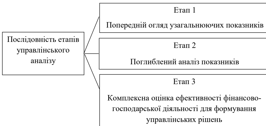
Рис. 4. Послідовність етапів управлінського аналізу