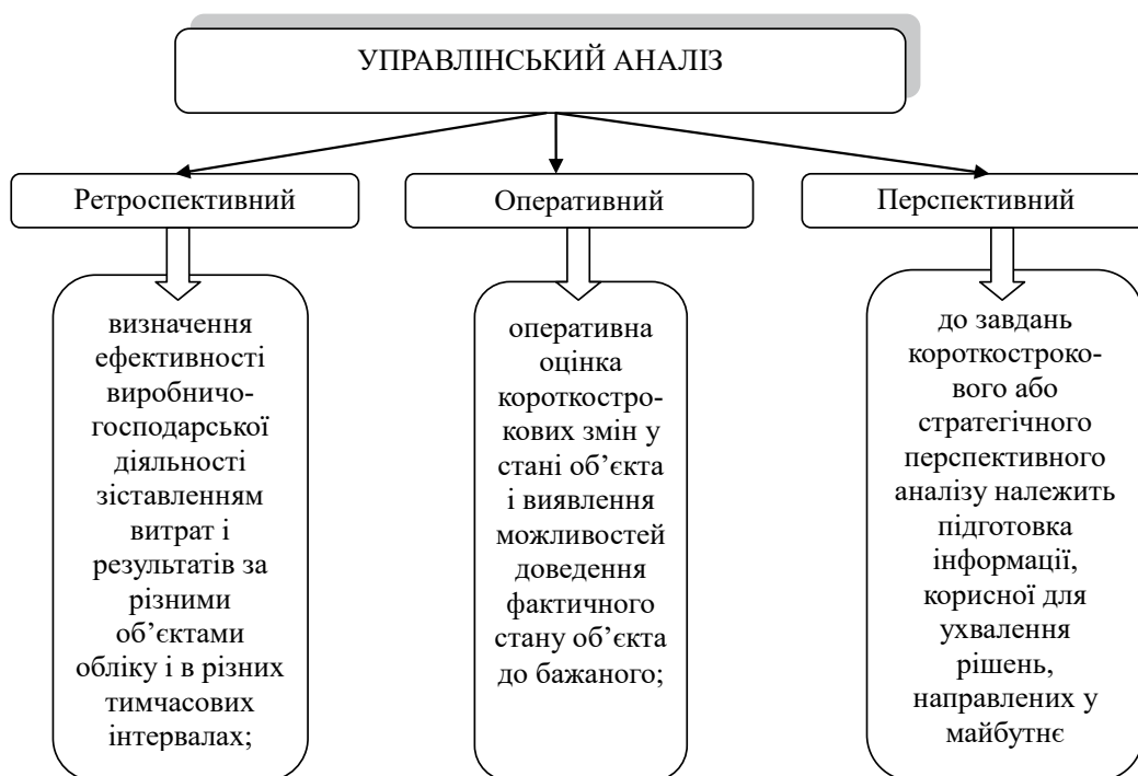
Рис. 3. Класифікація управлінського аналізу

1) методи, засновані на інтуїції керівників, вживані як результат накопиченого досвіду і знань у конкретній сфері діяльності; ухвалення управлінських рішень здійснюється без аргументованих доказів;