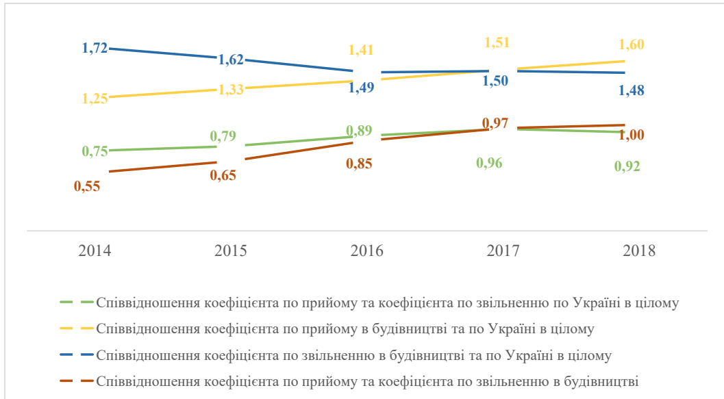
Рис. 2. Динаміка співвідношення коефіцієнтів з приходу та звільнення

рівень мобільності працюючих, але менші темпи зростання обсягів реалізації продукції (робіт, послуг) та витрат на персонал. Проведений аналіз є основою для формування стратегії на будівельного підприємства стосовно його персоналу як елемент оцінювання зовнішнього середовища та трендів ринку праці.