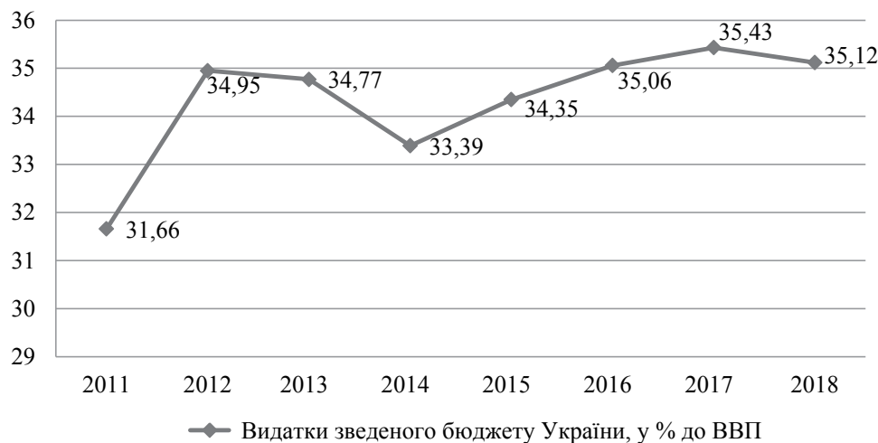
Рис. 2. Видатки зведеного бюджету України, у % до ВВП

Структура бюджетних видатків за функціональною класифікацією до 2018 року свідчить про підпорядкованість бюджетної політики змінам в політичній сфері, орієнтацію переважно на виконання поточних завдань та задоволення насамперед невідкладних потреб соціально-економічного роз-