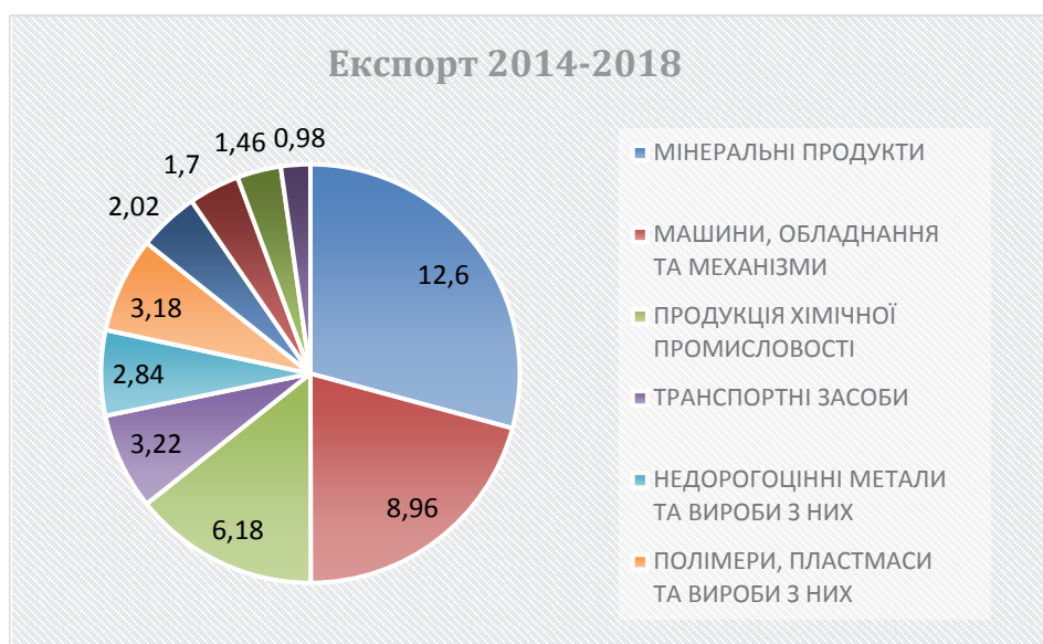
Рис. 1. Експорт продукції за 2014–2018 рр.

Простежується зменшення імпорту товарів в Україну у 2015–2016 роках порівняно з 2014 роком, де загальна сума товарів становила 54,4 млрд дол.