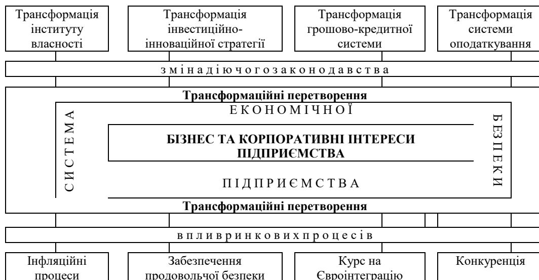
Рис. 2. Модель впливу трансформаційних процесів різної природи на економічну безпеку підприємства