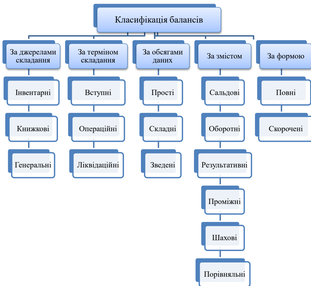
Рис. 1. Класифікація балансів