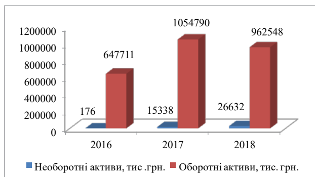
Рис. 3. Динаміка змін необоротних та оборотних активів в ТОВ «ФУД ДЕВЕЛОПМЕНТ»

– про перспективну ліквідність – це прогноз платоспроможності на основі порівняння майбутніх надходжень і платежів: A3 \geq P3 ; A4 \leq P4 . У разі