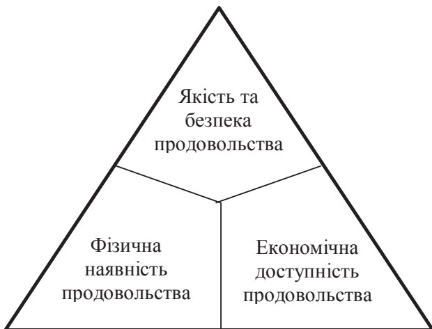
Рис. 1. Трилема системних умов продовольчої безпеки

щодо показників фізичної наявності та економічної доступності (рис. 2). Причина дисбалансу криється у самозабезпеченні населення продовольством, що є досить поширеним явищем в Україні.