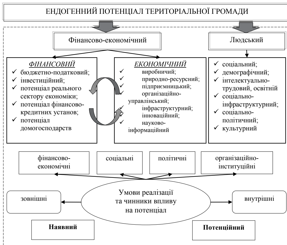
Рис. 3. Структурно-логічна схема ендogenous потенціалу територіальної громади