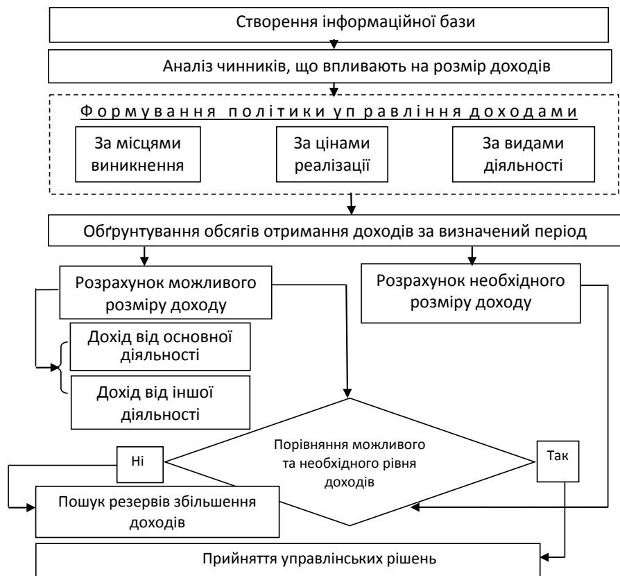
Рис. 2. Блок-схема аналізу доходів

1) можуть бути реалізовані без додаткових витрат;