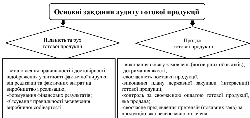
Рис. 1. Завдання аудиту руху готової продукції

Під час аудиту готової продукції використовують інформацію за операціями пов'язаними з рухом готової продукції на підставі звітів виробничих підрозділів та звітів про рух готової продукції зі складу при