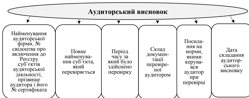
Рис. 4. Структура аудиторського висновку