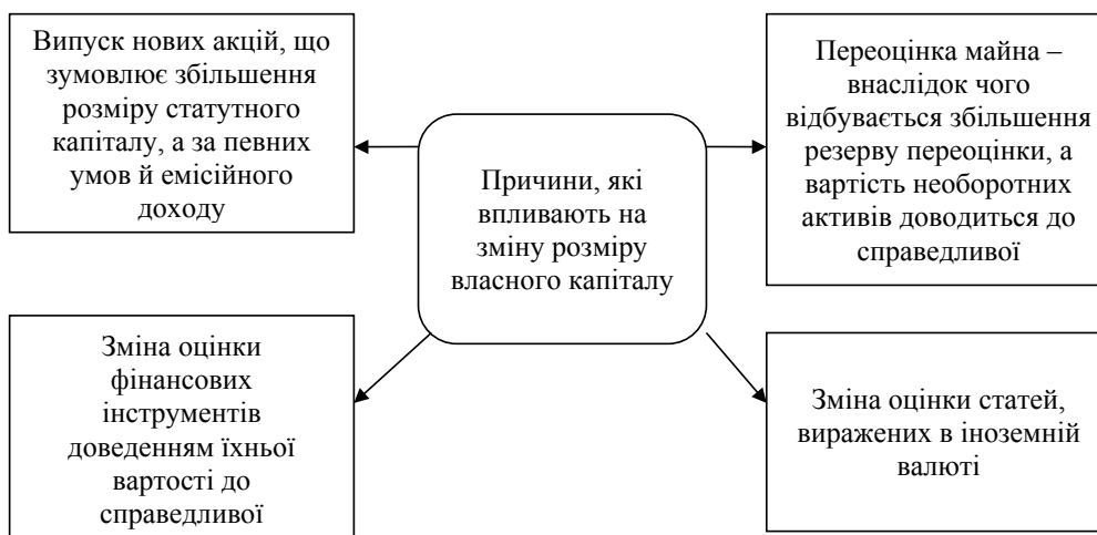
Рис. 2. Причини, які впливають на зміну розміру власного капіталу

капітал» не відповідає заявленому в установчих документах;