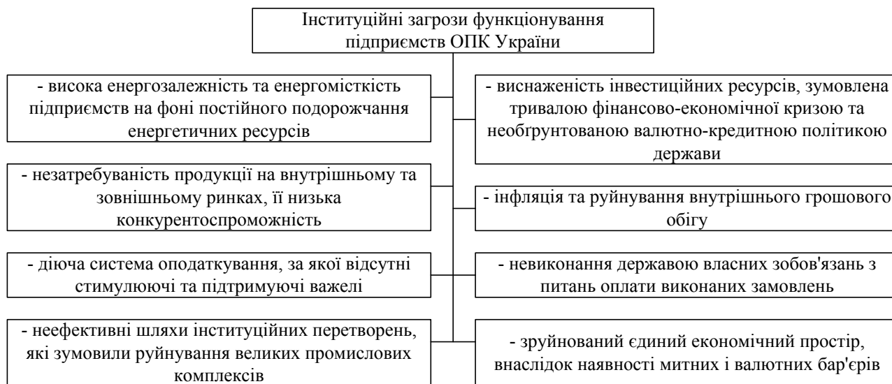
Рис. 1. Інституційні загрози функціонування підприємств оборонно-промислового комплексу України

До базових передумов створення та функціонування системи економічної безпеки підприємств ОПК належать теоретичні, інституційні, інформаційні, кадрові та фінансові. Серед базових передумов створення та функціонування системи економічної безпеки підприємств оборонної промисловості визначальна роль належить інституційним. Саме інституційні передумови відіграють вирішальну роль у формуванні системи економічної безпеки підприємств ОПК, оскільки вони охоплюють взаємодію підприємства із суб'єктами зовнішнього середовища. Адже система економічної безпеки підприємств оборонної промисловості функціонує не ізольовано, а в певному середовищі. Тому важливо, як суб'єкти зовнішнього середовища будуть реагувати на виконання цієї системою свого призначення – забезпечення