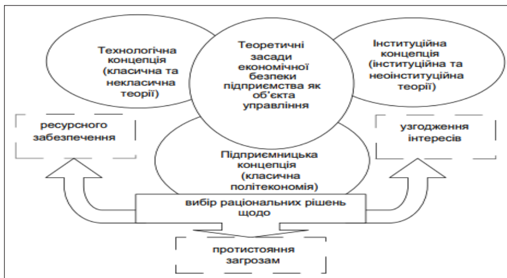
Рис. 2. Теоретичні засади економічної безпеки підприємства як об'єкта управління [7]

Тому узагальнюючою має бути така інтеграційна концепція, в рамках якої підприємство виконує роль системного інтегратора різноманітних соціально-економічних процесів у часі і просторі. При цьому ключовою ланкою є інтеграція у часі,