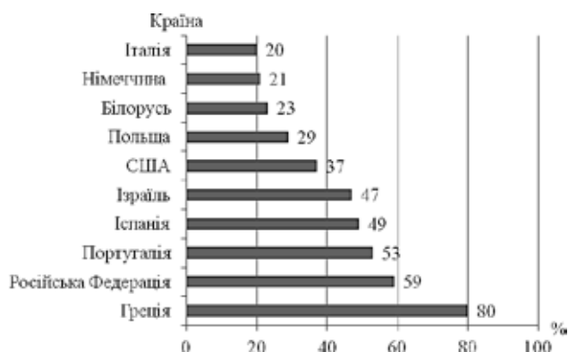
Рис. 1.3. Загальна кількість постійних мігрантів, що повернулися (1992-2013 рр.), у відсотках до загальної кількості мігрантів у відповідній країні в 2014-2015 рр.

Попри виїзд з країни кваліфікованих кадрів має місце і процес повернення на батьківщину трудових мігрантів. Загальна кількість постійних мігрантів, що повернулися (1992-2013 рр.), у відсотках до загальної кількості мігрантів у відповідній країні в 2014-2015 рр. проаналізовано на рисунку 1.3.